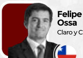
Felipe Ossa Claro y Cia