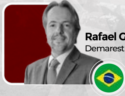
Rafael Gagliardi Demarest Advogados