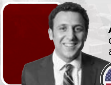
Ari MacKinnon Cleary Gottlieb Steen & Hamilton LLP