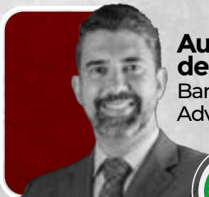
Augusto de Barros Figueiredo Barros de Figueiredo Advogados