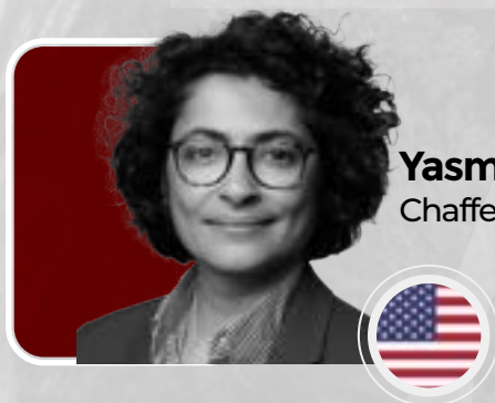
Yasmine Lahlou Chaffetz Lindsey LLP