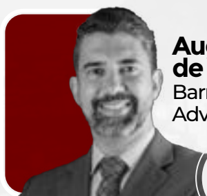
Augusto de Barros Figueiredo Barros de Figueiredo Advogados